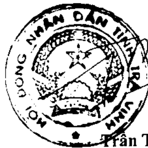
Trần Trí Dũng